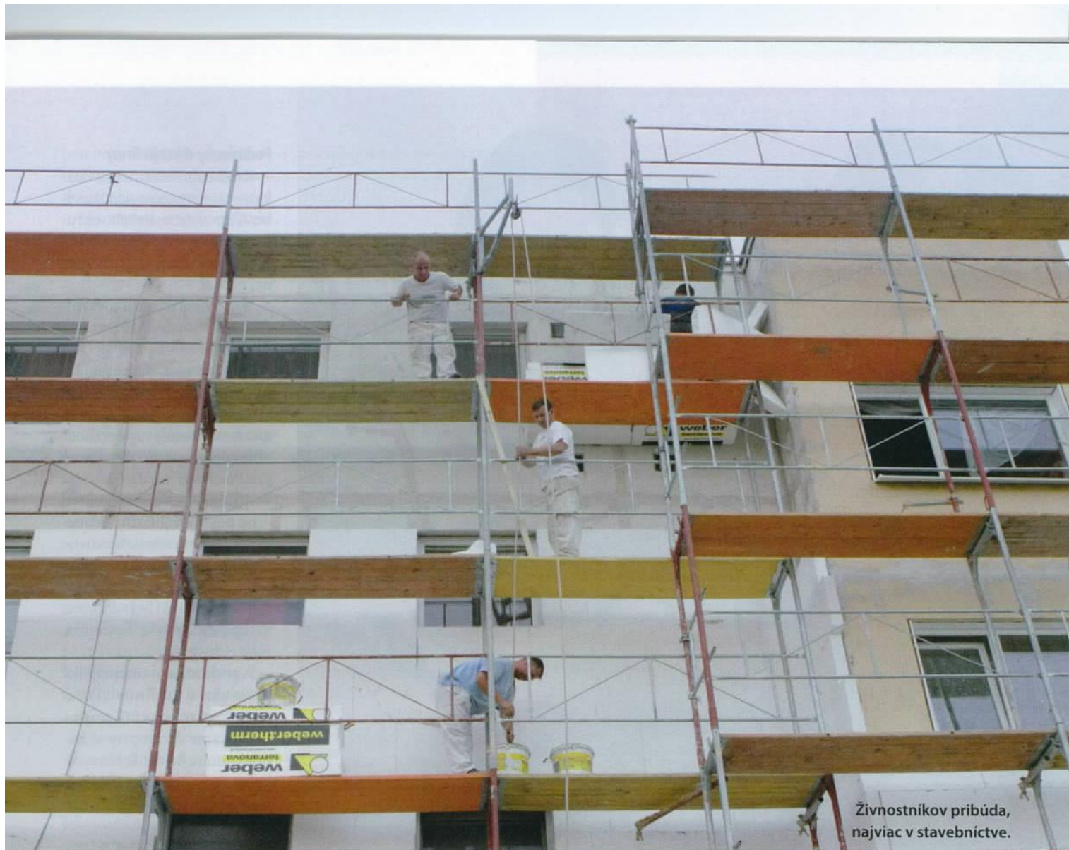
Živnostníkov pribúda, najviac v stavebníctve.