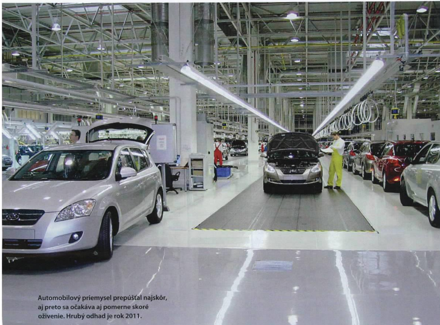
Automobilový priemysel prepúšťa najskôr, aj preto sa očakáva aj pomerne skoré oživenie. Hrubý odhad je rok 2011.