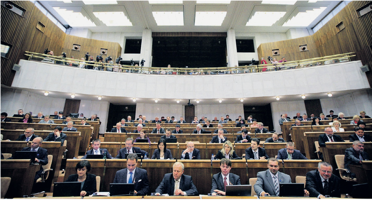
Hlasovanie parlamentu nie je vyvrcholením práce len pre poslancov.