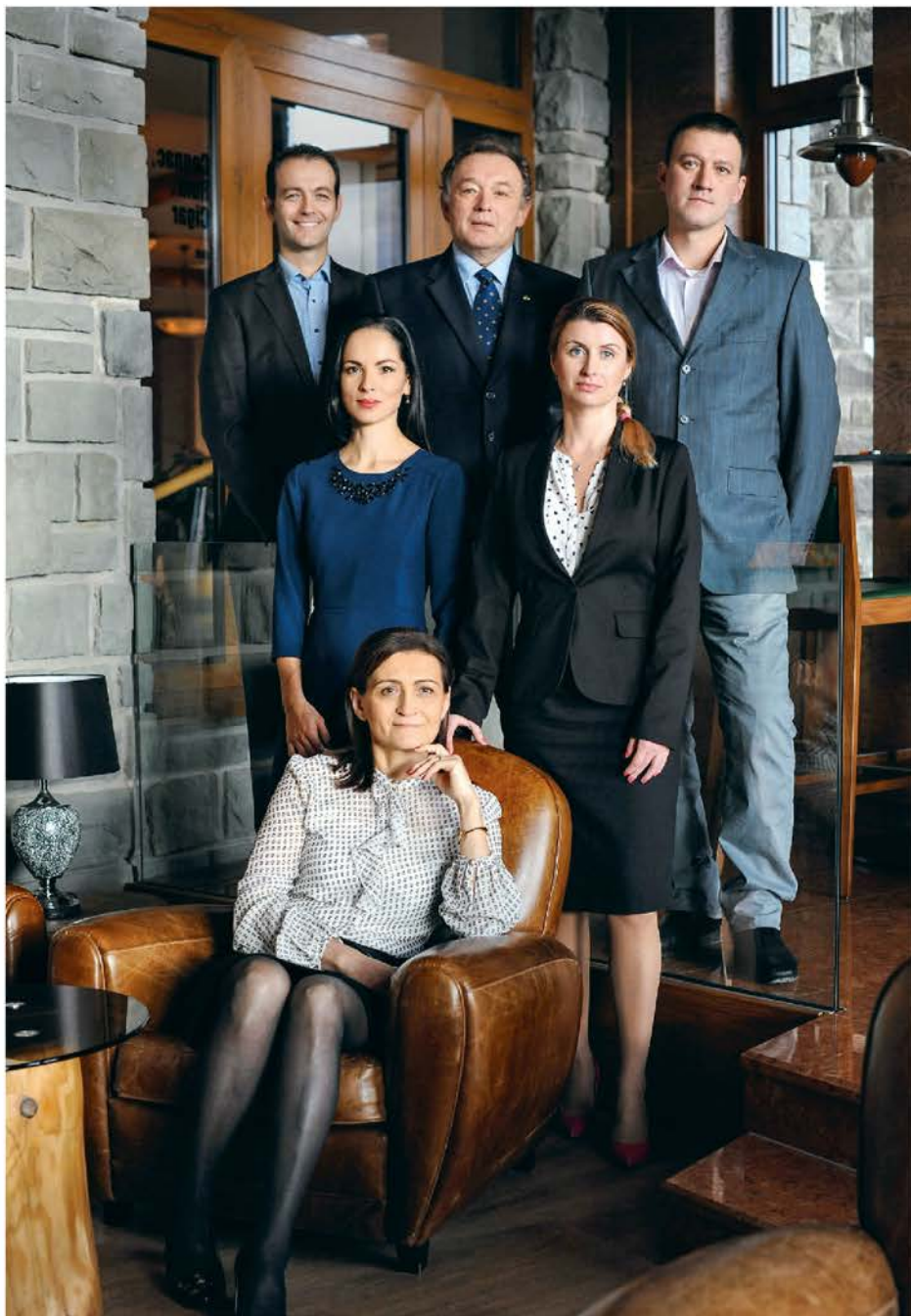
Kičovcov z Hotela Partizán na Táloch trápi okrem príplatkov za nočnú prácu a víkendy aj predĺženie odpisov hotelov a dvojnásobne vyššia DPH na služby než v okolitých štátoch.