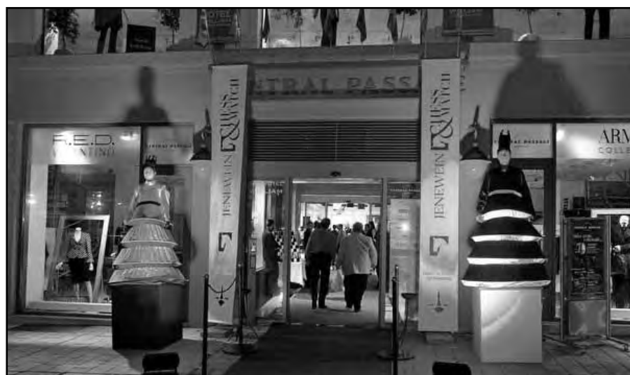
Vstup do Art Hotelu William na černo-bílou závěrečnou party zvýrazňovaly dvě živé šachové dámy