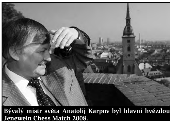
Bývalý mistr světa Anatolij Karpov byl hlavní hvězdou Jenewein Chess Match 2008.