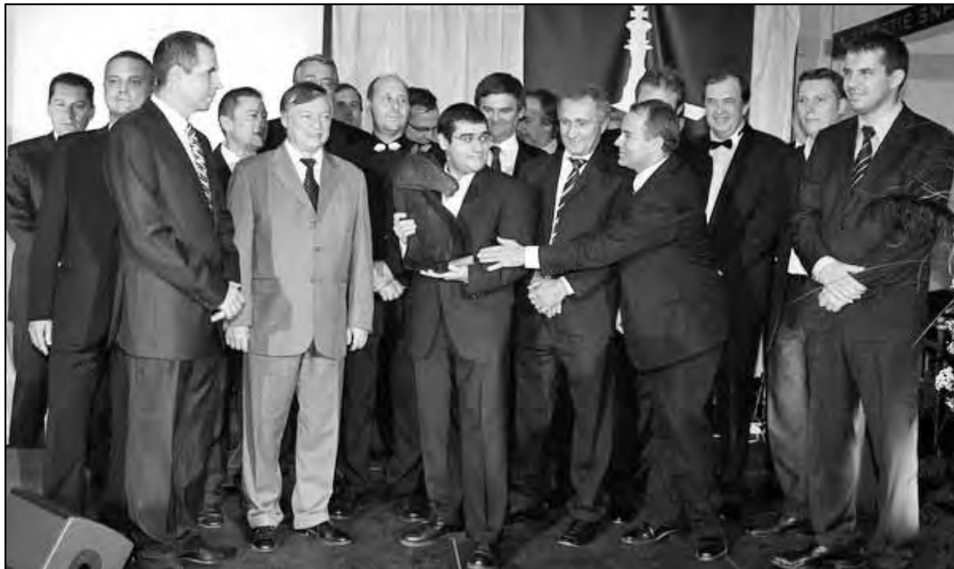
Slovenský tým s putovní trofejí pro vítěze Jenewein Chess Match 2008. Který tým bude mít v roce 2017 na poháru přilepeno více cedulek se jmény hráčů?