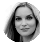
Veronika Poláčková moderátorka České televize

V divadle režíroval přes sto převážně operních inscenací na předních českých scénách i v zahraničí- Argentina, Estonsko, Finsko, Francie, Itálie, Irsko, Lotyšsko, Německo, Norsko, Slovensko, Slovinsko, USA. Inscenuje i činohru nebo muzikál.